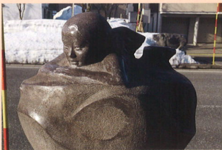
本多 正直 (ほんだ・まさなお)

1961 愛知県に生まれる 1987 多摩美術大学大学院彫刻科修了 2003 第9回十日町石彫シンポジウム参加 現在 愛知県在住