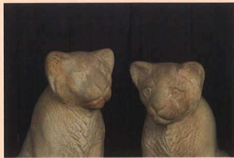
明地 信之 (あけち・のぶゆき)

1961 埼玉県に生まれる 1984 東京学芸大学教育学部美術科卒業 2009 第15回十日町石彫シンポジウム参加 現在 埼玉県在住