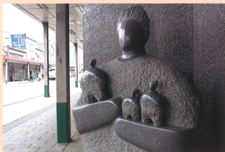
尾崎 慎 (おざき・しん)

1961 愛知県に生まれる 1987 多摩美術大学大学院彫刻科修了 2003 第9回十日町石彫シンポジウム参加 現在 愛知県在住