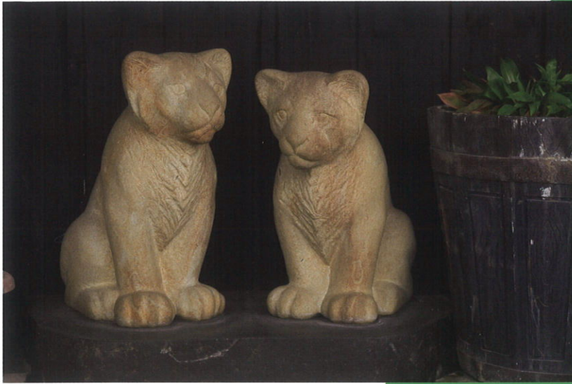
左上から：尾崎慎《未来を抱く》2003 中津川安山岩 [十日町駅通り・水園織物棟前] 本多正直《SEED OF PEACE 雲の上から》2009 安山岩 [ほくほく線十日町駅前] 明地信之《Leone》2004 大理石 [十日町市本町2丁目・ほんやら洞前]

OSAKI Shin 尾崎慎 HONDA Masahiko 本多正直 AKECHI Nobuyuki 明地信之